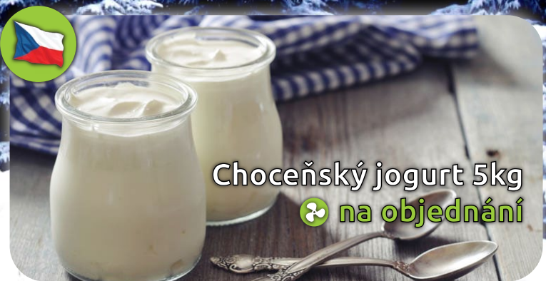
Chocenský jogurt 5kg ♻️ na objednání