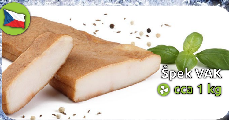
Špek VAK ♻️ cca 1 kg