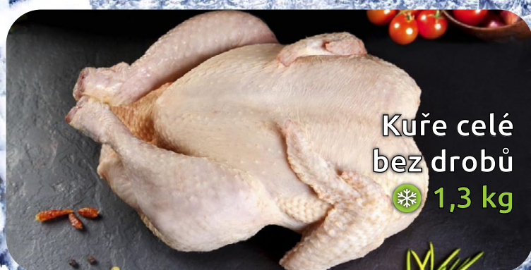
Kuře celé bez drobů 1,3 kg