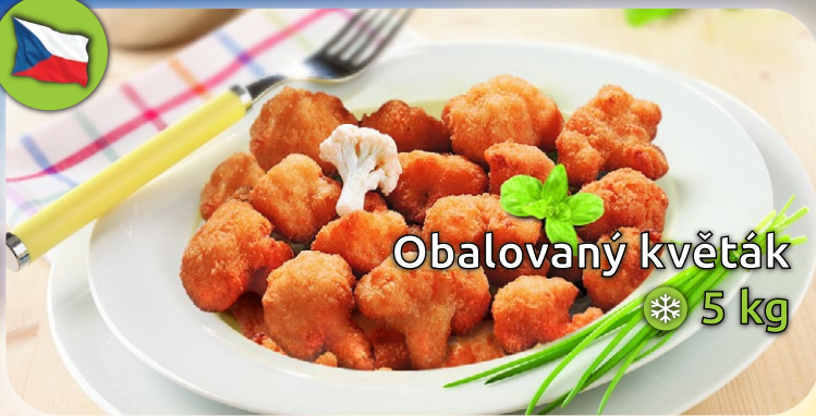
Obalovaný květák ❄️ 5 kg