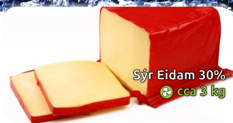
Sýr Eidam 30% ♻️ cca 3 kg