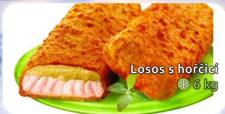
Losos s hořčicí 6 kg