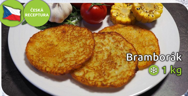
Bramborák ❄️ 1 kg