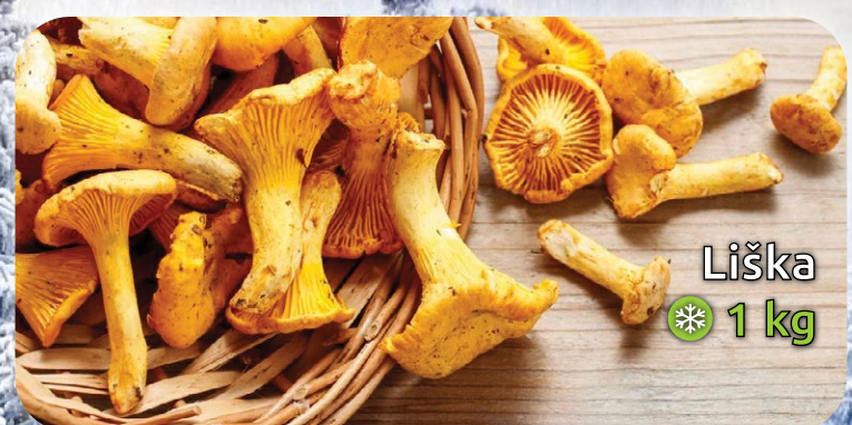
Liška ❄️ 1 kg