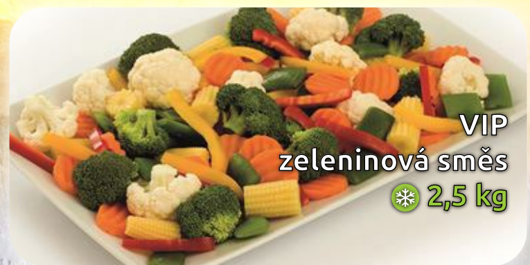
VIP zeleninová směs ❄️ 2,5 kg