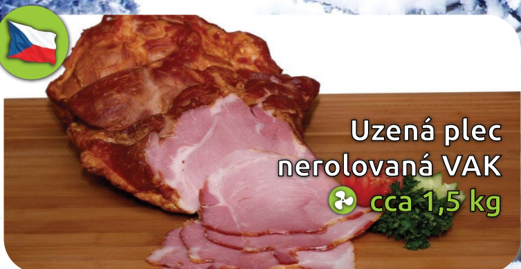
Uzená plec nerolovaná VAK cca 1,5 kg