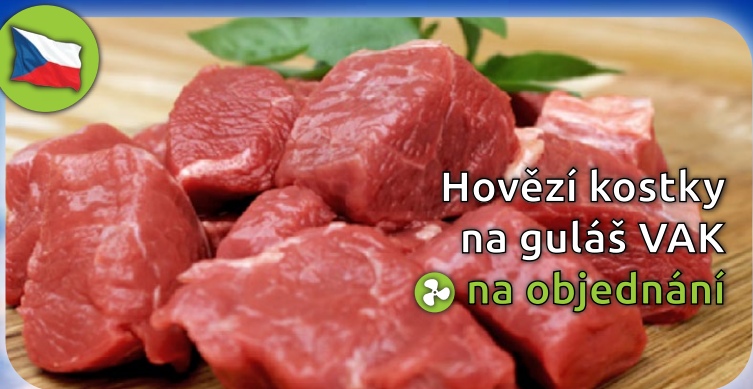
Hovězí kostky na guláš VAK na objednávání