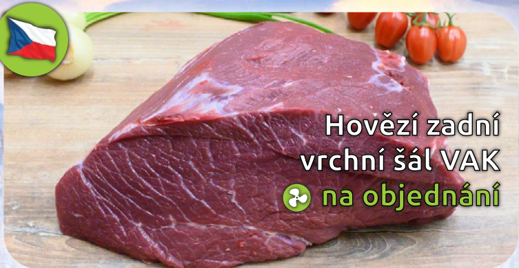
Hovězí zadní vrchní šál VAK na objednávání