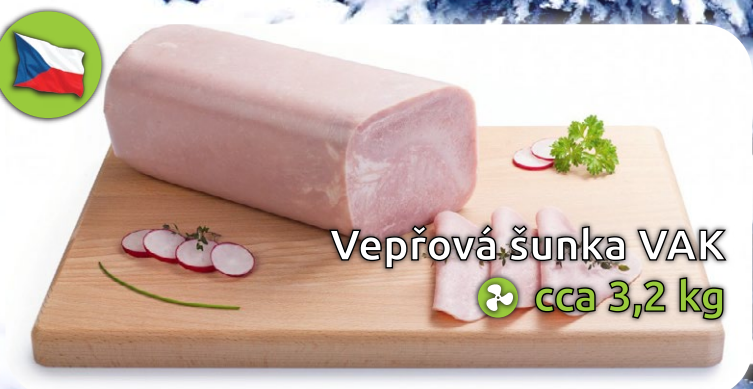
Vepřová šunka VAK cca 3,2 kg