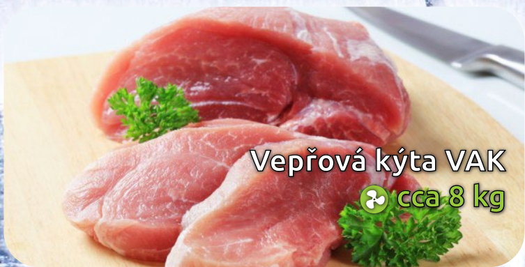
Vepřová kýta VAK cca 8 kg