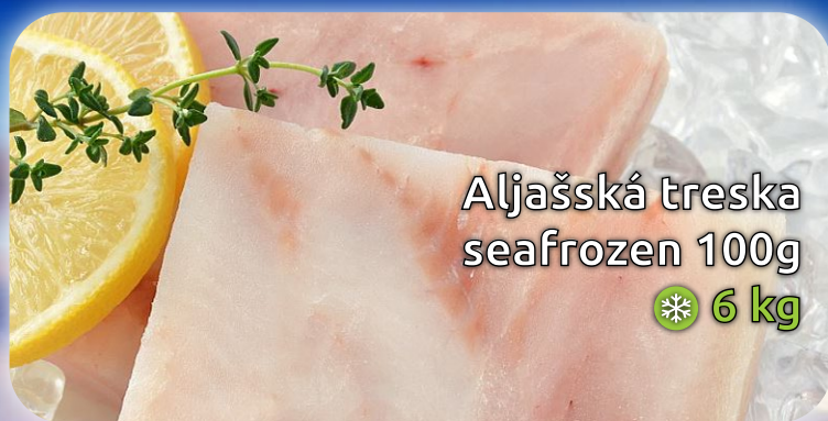
Aljašská treska seafrozen 100g 6 kg