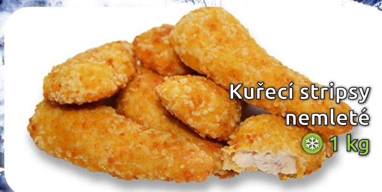
Kuřecí stripsy nemleté 1 kg