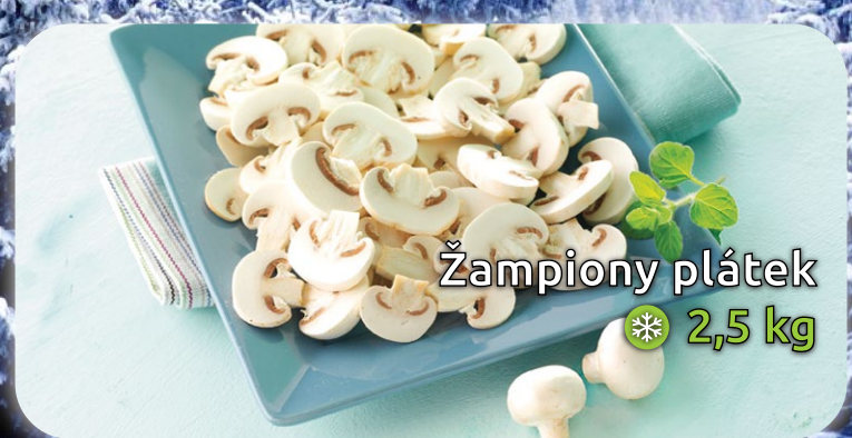
Žampiony plátek ❄️ 2,5 kg