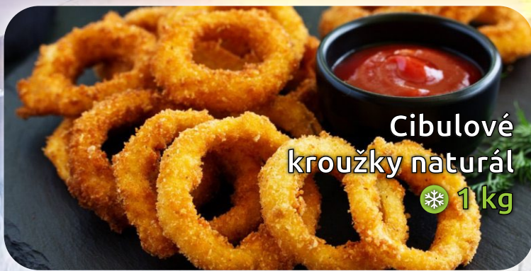
Cibulové kroužky naturál ❄️ 1 kg